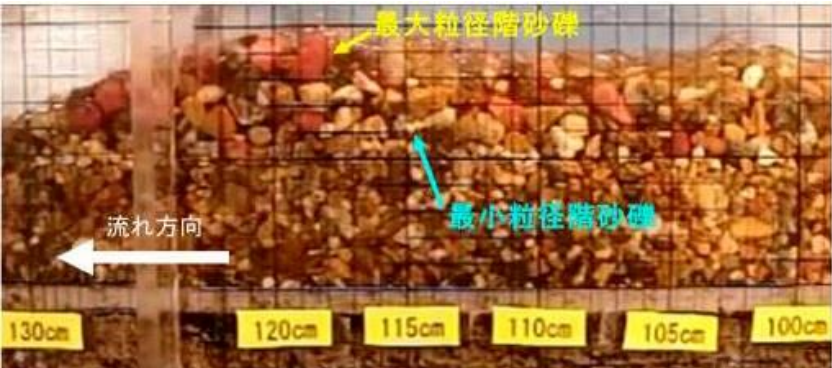
土石流先頭部の巨礫集積に関する水路実験