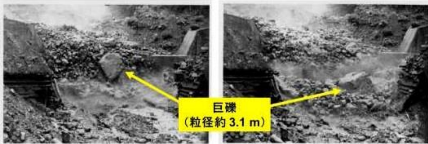
焼岳上々堀沢での土石流先頭部の様子(奥田, 1977)