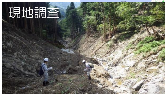
現地調査・航空写真データを活用した土砂災害形態分類